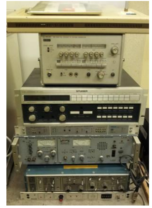
De stapel gekregen van Castor Broadcasting Services