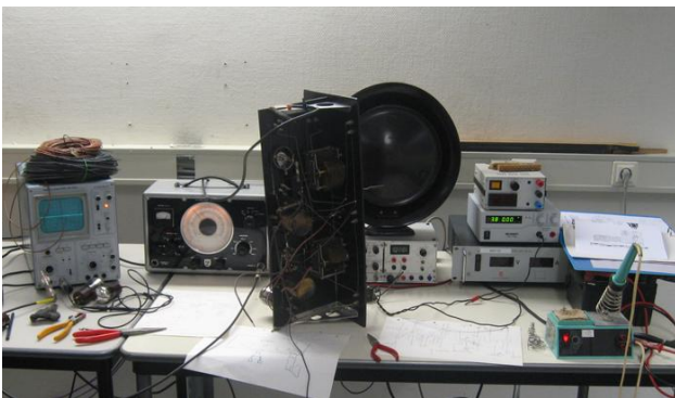
De radio in de teststelling

Ook al werkt een bijpassend plaatstroom apparaat uit dezelfde tijd ook, toch hebben we besloten om met moderne componenten alle benodigde spanningen voor de radio op te wekken. Deze nieuwe voeding werkt al maar moet nog netjes in een behuizing worden gemonteerd.