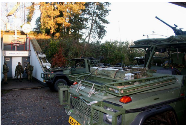
De militairen arriveren bij de bunker

Al vroeg in de ochtend op 9 december stond het leger op de stoep bij ons museum. De dag ervoor waren ze met touwen aan de buitenkant van de TV toren in Lopik neergedaald op aarde. Maar nu was het tijd om de bunker en omliggend terrein minutieus uit te kammen. Immers er waren aanwijzingen dat kwaad willenden in en om de bunker materialen hadden verborgen om daarmee een mogelijk een aanslag ergens in Nederland te kunnen plegen.