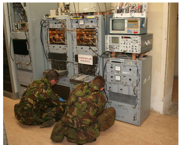
Ook alle apparatuur werd minutieus uitgekamd

Met het acute gevaar viel het overigens wel mee, dit bestond alleen in het draiboek van deze oefening van het 41e Pantser geniebataljon van de Koninklijke Landmacht. De taak van dit legeronderdeel was om deze verborgen spullen op te sporen en in beslag te nemen. Het viel niet mee om in een gebouw met zoveel verborgen hoekjes en gaatje de verborgen spullen te vinden. Ook op het omliggende terrein is er ruimschoots gelegenheid om zaken die het daglicht niet kunnen verdragen op te slaan.