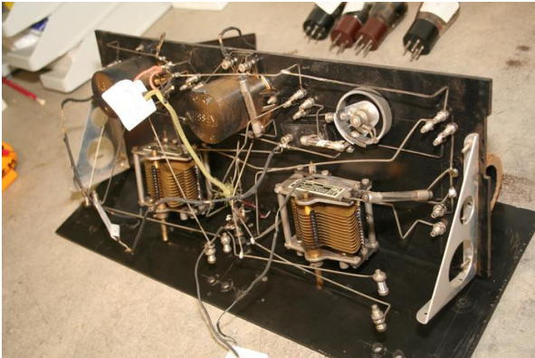
De opgeknapte frontplaat wordt teruggezet

worden opgeknapt en de radiolampen worden getest. Een defecte buis werd vervangen. De vervangende buis is wel van een iets ander type, maar het geheel werkt.