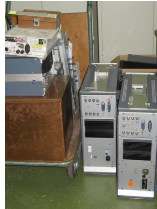
Een kar vol afgedankte KPN meetapparaten in de leeftijd van 30+ jaar.