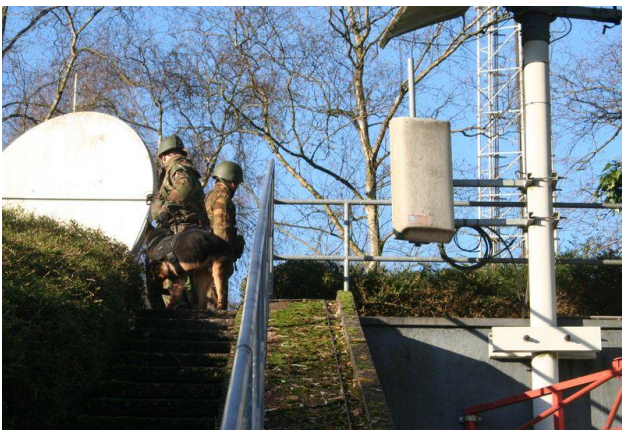
Onderzoek op het dak van de bunker

Onder een stralende zon konden de mannen en de honden ook buiten het nodige onderzoeken. Van het dak van de bunker tot de waterputten in de grond, niets werd overgeslagen.